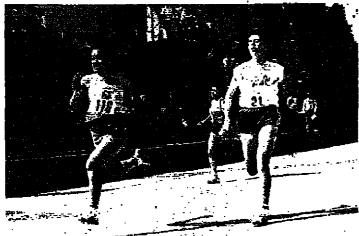
سباق المئة متر للأصوات